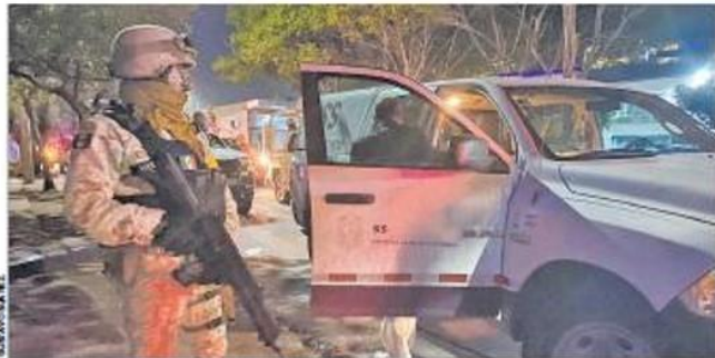
• El primer cargamento de vacunas anticovid, para el personal del sector salud, llegó anoche al aeropuerto de Tijuana.

• Personal militar y funcionarios estatales recibieron en la Base Aérea Militar 70 76, el primer cargamento de vacunas contra el covid 19, que serán aplicadas a partir de hoy a personal médico. 06