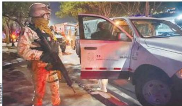
• Un fuerte operativo militar transportó las vacunas al Hospital General de Tijuana.