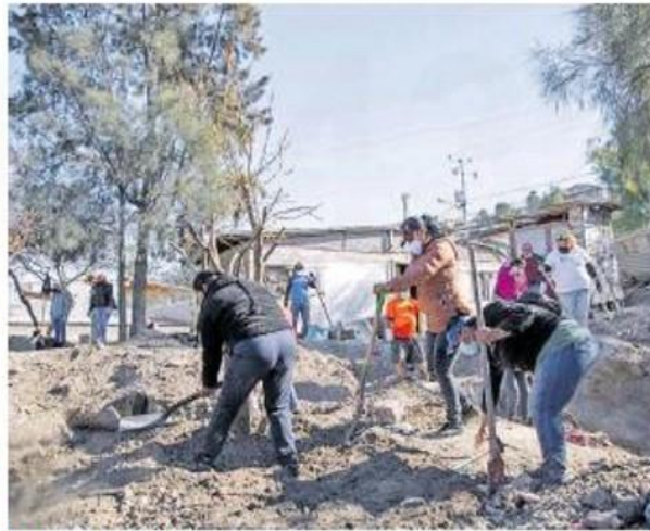
Las labores de búsqueda iniciaron el pasado martes 5 de enero